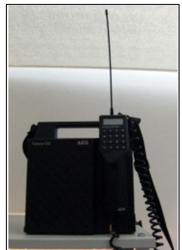
Handy von 1987; Gewicht ca. 5 kg