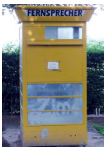
Ein alter Fernsprecher draußen vor dem Museum

(JD) Am 09. Juni diesen Jahres war es sonnig und die Temperaturen entsprechend hoch, also geht man besser in den Garten oder ist sonst wie draußen aktiv. Nur so lässt es sich erklären, dass bei der Besichtigung des Verstärkeramtes in St. Vit –