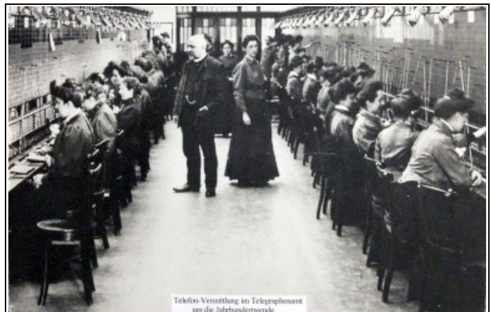
Telefonvermittlung im Telegraphenamt um die Jahrhundertwende

Räume bekamen zur Tarnung ein nachempfundenes westfälisches Bauernhaus aufgesetzt. Nach dem 2. Weltkrieg kamen weitere Dienste hinzu: Rundfunk, Fernsehen, Luft- u. Katastrophenschutz usw.. Durch den Einsatz neuerer Techniken wurde dieser Standort überflüssig. 1995 schaltete die Telekom die Anlagen ab.