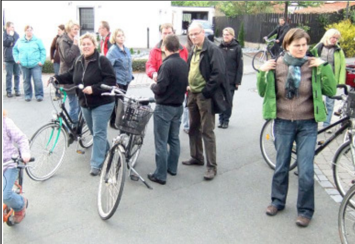
Aufbruch bei Kehl und Pause im Bruch

Viele Leute aus Dedinghausen wissen bei einem