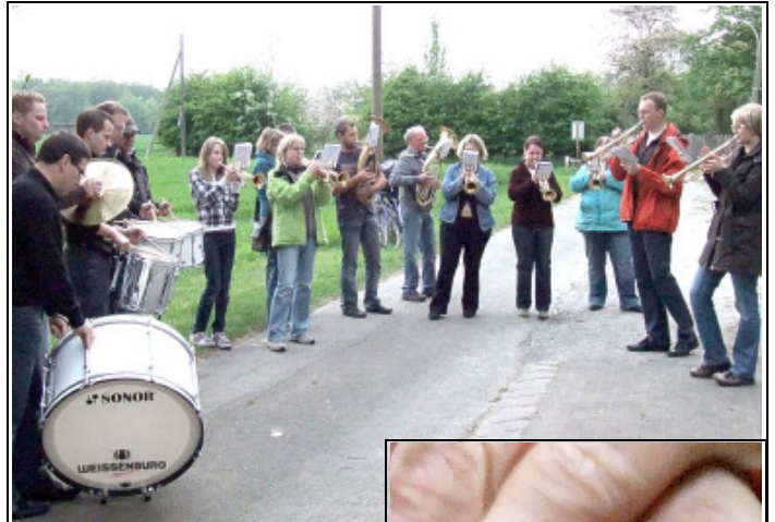
„Spontan und Ungezwungen“ spielen auf

Das Wetter spielte zum Glück auch mit, so dass die Kinder draußen an der Hütte spielten und die