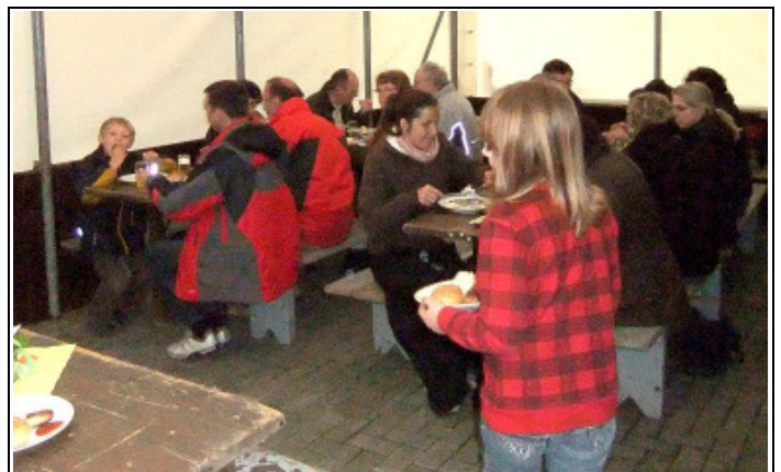
Die Salate und das Grillgut fanden reißenden Absatz