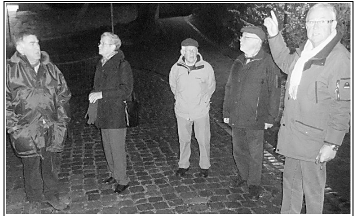
Am 22.11. fuhr die Kolpingsfamilie nach Büren.

Die Mühle wurde 2006 von der Stadt Büren übernommen, nachdem sie über etliche Jahre leerstand und zusehends verfiel. An Dach und Mauerwerk